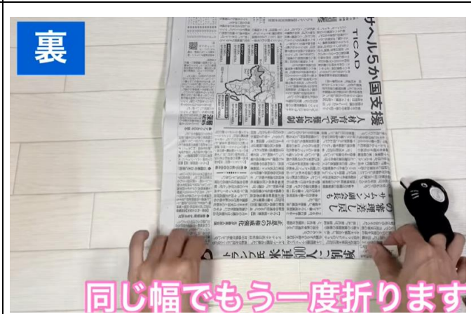
同じ幅でもう一度折ります