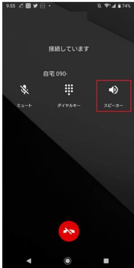
スピーカーがオフの状態

通話画面にあるスピーカーのマークをタップするだけで OK です。これでスマホを手を持たずに通話、いわゆる「ハンズフリー通話」ができます。通話画面で見るとこんな感じです。オンにすると、マークの色が変わります。LINE でも同様に使えます。